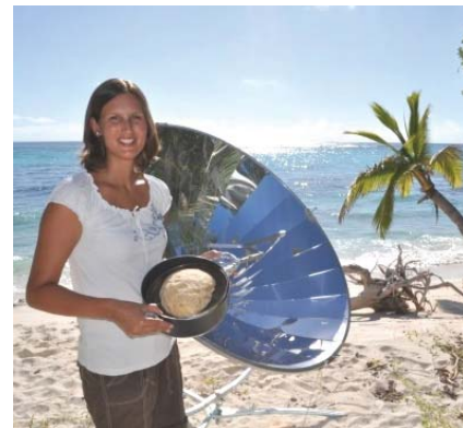
Das Brot ist in weniger als in 1 Stunde fertig!