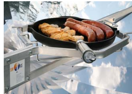
Rauchfreies Grillen auf dem Solarkocher.