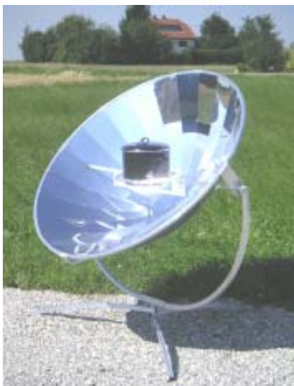
Diseño elegante, funcionamiento fiable y el mayor confort de uso.

Hornillo solar Premium14 N° ref.: 110-0007 449,00 EUR