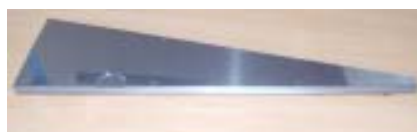
Juego de chapas SK14, longitud de chapas 86 cm