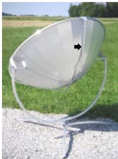
Vista posterior del hornillo solar. El reflector está protegido de los desperfectos mediante un arco antivuelco (véase la flecha).

Diámetro del reflector = 140 cm Potencia 700 vatios con cielo despejado (1 litros de agua hierven en 9 minutos), Peso, embalaje incl. 18,5 kg Medidas del paquete: 117 x 55 x 10 cm